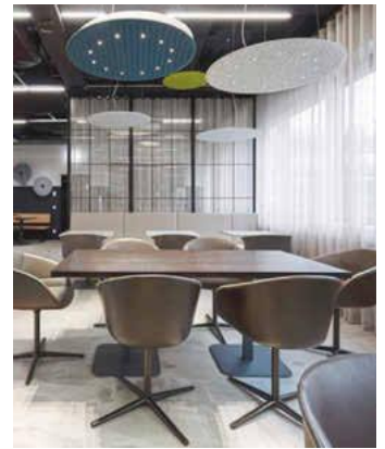
/ Eine runde Sache: Blendfreie Beleuchtung mit Nimbus-Lighting-Pads-R.

spektrum und Serviceangebot für Schreiner und Tischler bereit. (hf)