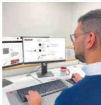
/ Ostermann bietet kostenlose Lichtplanung und Leuchtenkonfigurator.

einfach im neuen Konfigurator. Hier können Kunden ihre Leuchte aus verschiedenen Channelline-Leuchtenkanälen und Versa-Inside-LED-Strips zusammenstellen. Alle Infos zu den neuen Services finden sich auch unter dem Suchbegriff #Leuchterservices auf der Ostermann-Website. (hf)