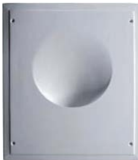
Weiche Übergänge: Der Leuchtkörper aus Gips wird flächenbündig mit der Gipskartonwand verspachtelt