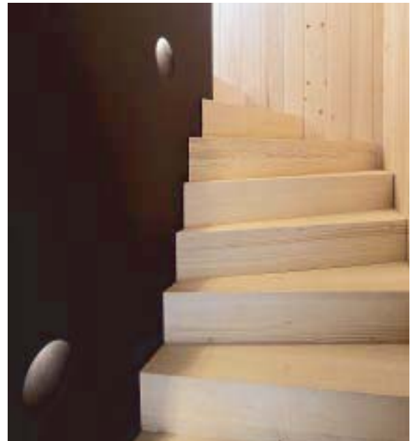
Auch als Downlight zur Treppenbeleuchtung geeignet

Licht aus dem Off: Innovative Einbauleuchte ohne sichtbaren Leuchtkörper